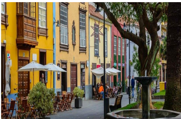
San Cristobal de la Laguna

Prima colazione. Alle ore 09:00 partiremo per l'icona delle isole Canarie, il monte sacro degli abitanti primitivi e il picco più alto della Spagna (3.718 m): il Teide. Nell'ascensione incontreremo tutti i vari cambiamenti di vegetazione, dalla subtropicale alla alpina. Arrivati al cratere principale troveremo un paesaggio lunare, che lo ha reso set cinematografico di tanti film sullo spazio. Colori, vegetazione, animali... tutto fa da cornice al maestoso Teide. Si scenderà dalla parte nord dell'isola, circondati dal verde dei boschi e dall'azzurro del mare, con la capitale sullo sfondo: Santa Cruz de Tenerife. Cena e pernottamento.