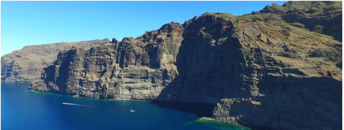
La scogliera de Los Gigantes, vicino al nostro albergo

Dopo prima colazione , trasferimento libero per l'aeroporto e partenza con volo di linea per l'Italia.