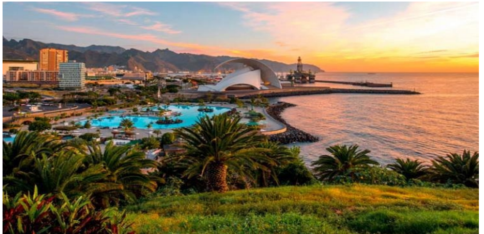
Santa Cruz de Tenerife

Prima colazione. Giornata libera per godere del clima di 'eterna primavera' proprio di questa isola, sia passeggiando sulla vicina spiaggia di sabbia nera 'la arena', o sfruttando le diverse piscine nel nostro albergo. Questa struttura ha un'ampia programmazione di animazione diurna e serale. È il momento per il relax. Cena a buffet e pernottamento.