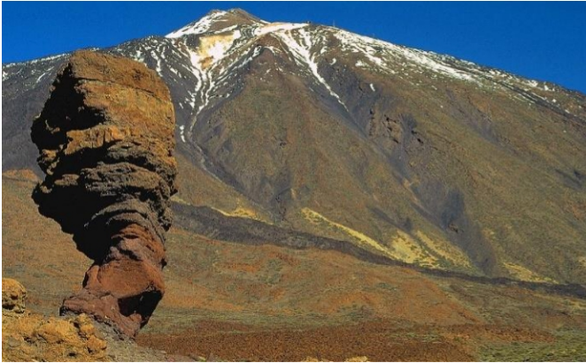
Il Picco del Teide da Las Cañadas (il cratere del vulcano)