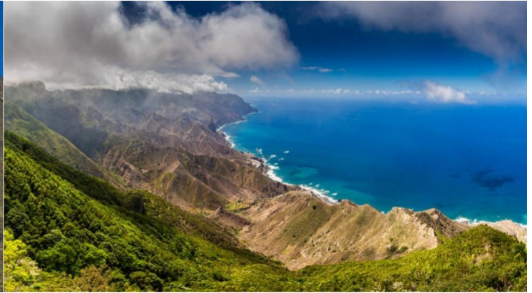
Costa di Taganana